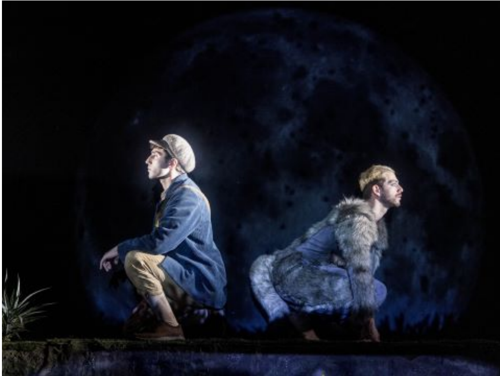
"הזאב הטוב"